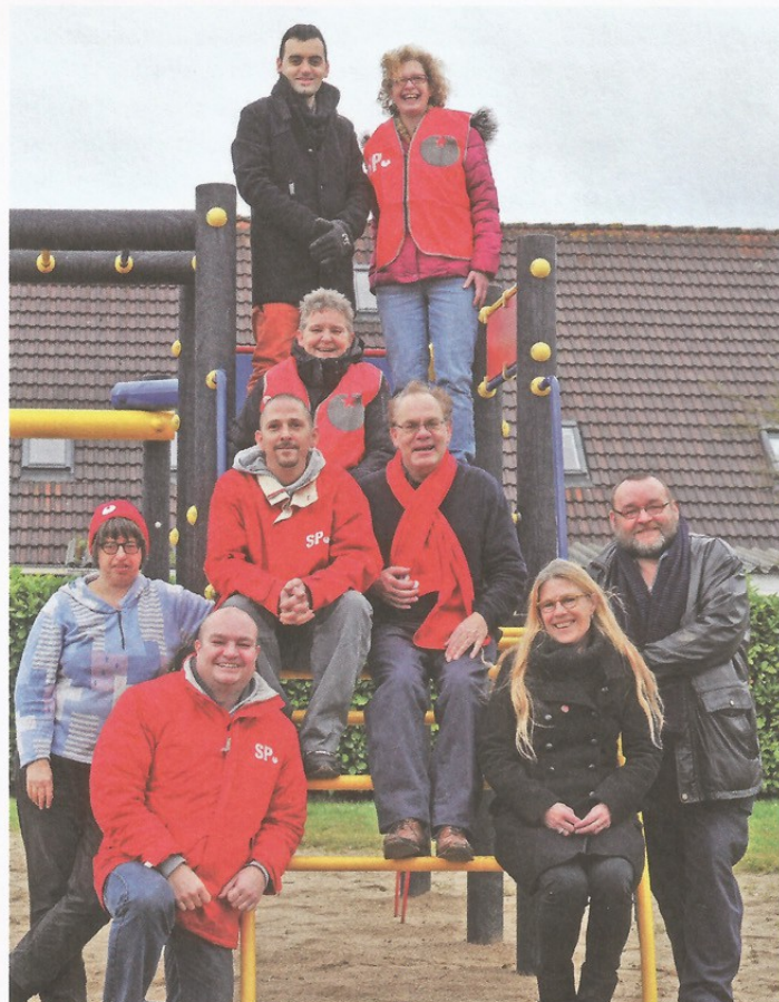
Bestuur SP Doesburg.