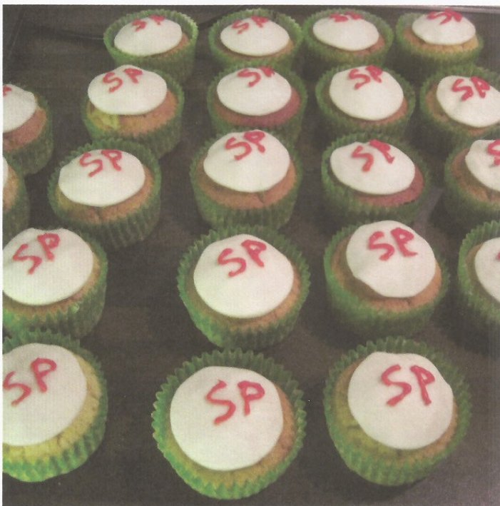
Koffie met SP-cake, een luisterend oor en een hart onder de riem voor de vrijwilligers en gebruikers van de inloop van de linie.

dat 75.000 euro kosten? De kosten van het verplaatsen van de Stadswerf en de nieuwe milieustraat bij het zwembad zijn nog niet duidelijk, maar ongetwijfeld hoog. Natuurlijk is het er krap, maar is dit nu echt nodig? Nee. Niet doen, en dus ook de afvalstoffenheffing niet verhogen.'